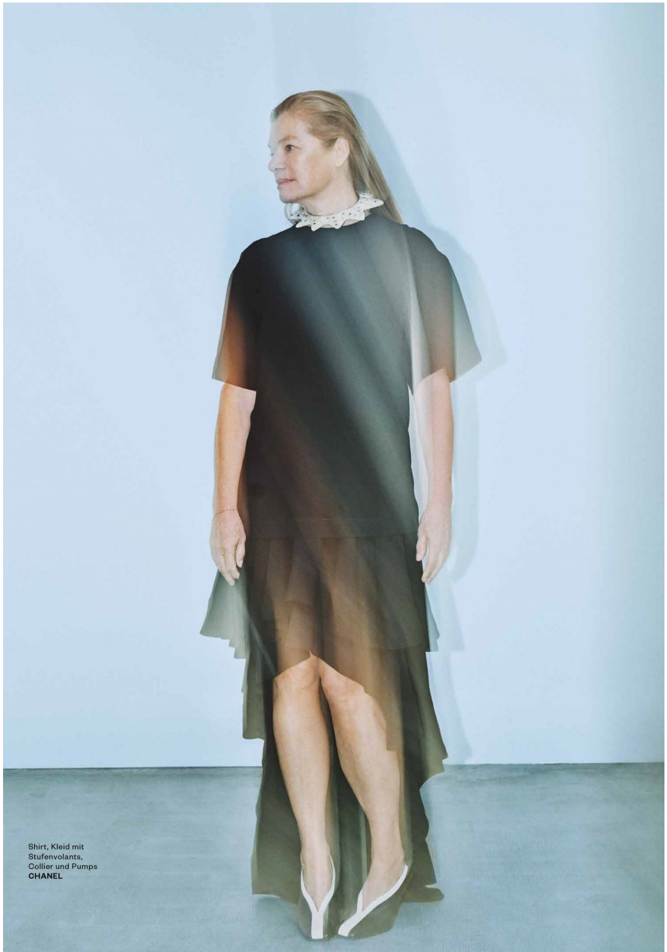
Shirt, Kleid mit Stufenvolants, Collier und Pumps CHANEL

HEIGHT 177 CM / 5'9.5" | CHEST 99 CM / 39" | WAIST 77 / 30.5 | HIPS 97 CM / 38" | HAIR DARK BLONDE | EYES BLUE DRESS 38-40 EU / 6-8 US / 10-12 UK | SHOES 39 EU / 8 US / 6 UK