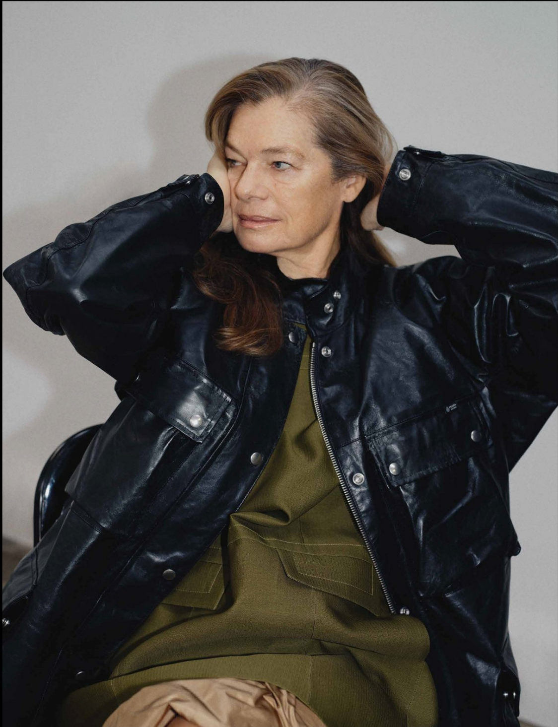
Nappaleder-Parka, Shiftkleid und Ballonrock PRADA

HEIGHT 177 CM / 5'9.5" | CHEST 99 CM / 39" | WAIST 77 / 30.5 | HIPS 97 CM/38" | HAIR DARK BLONDE | EYES BLUE DRESS 38-40 EU/6-8 US/10-12 UK | SHOES 39 EU/8 US/6 UK